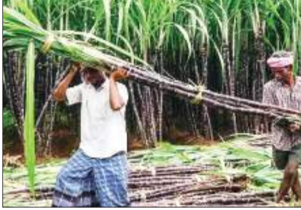
कैबिनेट: केंद्रीय मंत्रिमंडल ने पीएम प्रणाम योजना को मंजूरी दी

टीम एक्शन इंडिया/नई दिल्ली केंद्र सरकार ने 2023-24 सीजन के लिए गन्ने का उचित और लाभकारी मूल्य (एफआरपी) 10 रुपये प्रति क्विंटल बढ़ाकर 315 रुपये प्रति क्विंटल कर दिया। केंद्रीय सूचना एवं प्रसारण मंत्री अनुराग ठाकुर ने बुधवार को यहां संवाददाता सम्मेलन में कहा कि प्रधानमंत्री नरेंद्र मोदी की अध्यक्षता में केंद्रीय मंत्रिमंडल की बैठक में आर्थिक मामलों की कैबिनेट समिति (सीसीईए) ने चीनी सीजन 2023-24 (अक्टूबर-सितंबर) के लिए 10.25 प्रतिशत की मूल रिकवरी दर के लिए गन्ने के उचित और लाभकारी मूल्य (एफआरपी) को 315 रुपये प्रति क्विंटल पर मंजूरी दी। उन्होंने कहा कि 10.25 प्रतिशत से अधिक वसूली में प्रत्येक 0.1 प्रतिशत वृद्धि के लिए 3.07