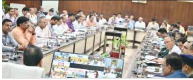
विभिन्न विभागों में किसी क्षेत्र में अधिक शिकायतें आ रही हैं, तो इनका भी अलग से डाटा रखा जाए

टीम एक्शन इंडिया/देहरादून सीएम हेल्पलाइन-1905 की सभी जिलाधिकारी माह में दो बार समीक्षा करें। सचिव एवं विभागीय एचओडी भी इसकी नियमित समीक्षा करें। सीएम हेल्पलाइन पर प्राप्त शिकायतों पर त्वरित समाधान के लिए प्रत्येक कार्यदिवस पर कुछ शिकायतकर्ताओं से जिलाधिकारी बात करें। यह निर्देश मुख्यमंत्री पुष्कर सिंह धामी ने सचिवालय में सीएम हेल्पलाइन-1905 की समीक्षा के दौरान अधिकारियों को दिये। मुख्यमंत्री हर माह के अन्तिम गुरुवार को सीएम