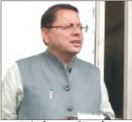
उत्तराखंड के सीएम पुष्कर सिंह धामी मीडिया से मुखातिब होते हुए।